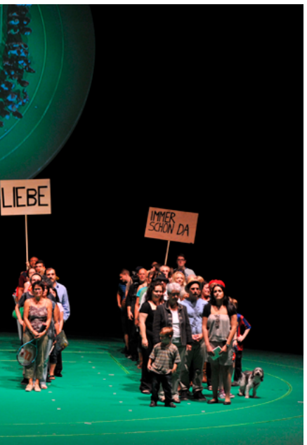
„100% Karlsruhe“ im Jahr 2011